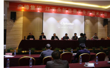
▲ 陕西、江西专项培训现场