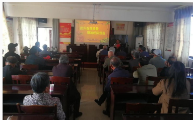
▲ 专项职业能力和项目制培训