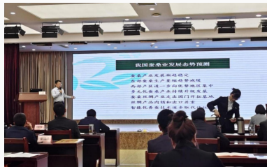
▲ 线上+线下培训现场